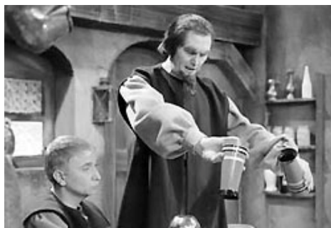
Flip de Toveraarsleerling