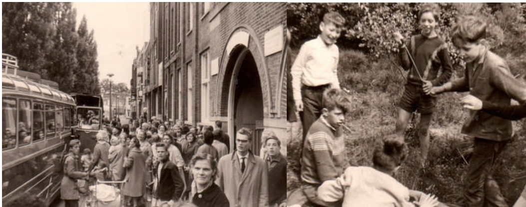
Zomerkamp SFL Groningen

het Maatschappelijk Werk voor Minderbedeelden daar onder verantwoordelijkheid van de Paters door vrijwilligers uitgevoerd. In de jaren vijftig van de vorige eeuw viel deze verantwoordelijkheid onder een wereldgeestelijke. De doelstelling van het SFL, zoals het Liefdeswerk kortweg werd genoemd, was: 'zedelijke, godsdienstige en maatschappelijke verheffing van godsdienstig en maatschappelijk verwaarloosde en achterlijke katholieke jongeren der stad'. Er werden clubs opgericht waarbij godsdienstonderricht werd gegeven maar ook gymnastiek en sport, zang, toneel, spelletjes en een zaagcursus stonden op het programma. Eenmaal per jaar werd er op zomerkamp gegaan. Verspreid over geheel Nederland waren groeperingen onder dezelfde naam actief en in Groningen zou het werk van het SFL later een nog grotere maatschappelijke taak krijgen en de naam veranderen in Rooms Katholieke Jeugdzorg.